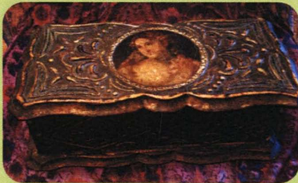
กล่องแกะสลักปิดทองและติดรูปภาพ สไตล์เดคูพาจแบบสกุลช่างฟรอลเลนซ์

เดคูพาจ ปรากฏขึ้นครั้งแรกที่นครเวนิส ประเทศอิตาลี ในชื่อ l'arte del povero เป็นงานที่ใช้วิธีพิมพ์ภาพบนกระดาษจำนวนมากเพื่อฉีกบนชิ้นงานที่ทำสีพื้นเตรียมไว้และเคลือบจนขึ้นเงา ต่อมาได้แพร่หลายไปสู่ประเทศต่างๆ และเฟื่องฟูมากในสมัยวิกตอเรียของอังกฤษ แต่หยุดชะงักลงในช่วงสงครามโลกทั้ง 2 ครั้ง เมื่อรีอ์ฟื้นขึ้นใหม่ได้ชื่อว่า Découpage ซึ่งมาจากคำว่า Découper ในภาษาฝรั่งเศส แปลว่า ตัด