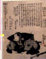
เจ้าหญิงฮิเมจิ