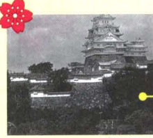
ปราสาทฮิเมจิ