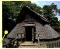
บ้านชนชั้นสูง