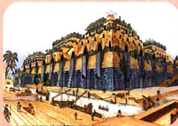
อาณาจักรบาบิโลน